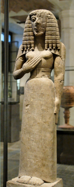
Statuette féminine dite « La Dame d'Auxerre », vers 640-630 av. J.-C.

Décrivez la statue en insistant sur l'attitude de la jeune femme.