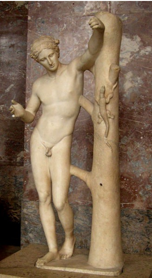
L'Apollon Sauroctone, copie romaine du Ier ou IIe siècle d'un original grec du Ve siècle av. J.-C., Paris, Musée du Louvre.

Montrez qu'il s'agit d'une copie d'un original en bronze.