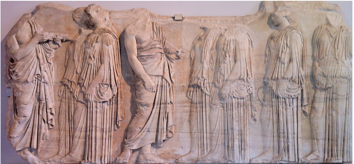
Frise des Ergastines, façade est du Parthénon d'Athènes, Paris, Musée du Louvre.

Qui sont les Ergastines et quel est leur rôle dans la religion civique athénienne ?