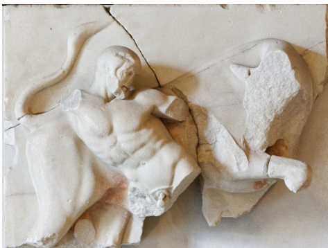
Héraclès et le taureau de Crète , métope ouest du temple de Zeus olympien, vers 460 av. J.-C., Paris, Musée du Louvre.