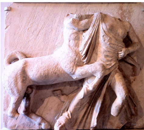
Centaure enlevant une femme lapithe , métope sud du temple de l'Acropole, vers 447-440 av. J.-C., Paris, Musée du Louvre.

Sur le temple du Parthénon, quel est le sujet représenté dans les métopes ? Quel sens ces scènes peuvent-elles avoir ?