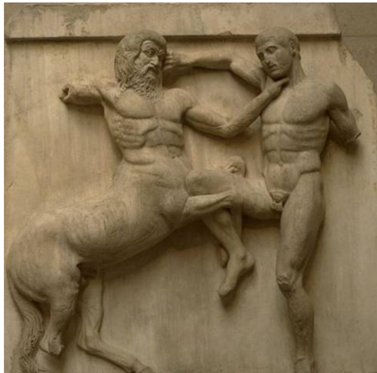
Métope représentant la Centauromachie, frise intérieure du Parthénon, Athènes