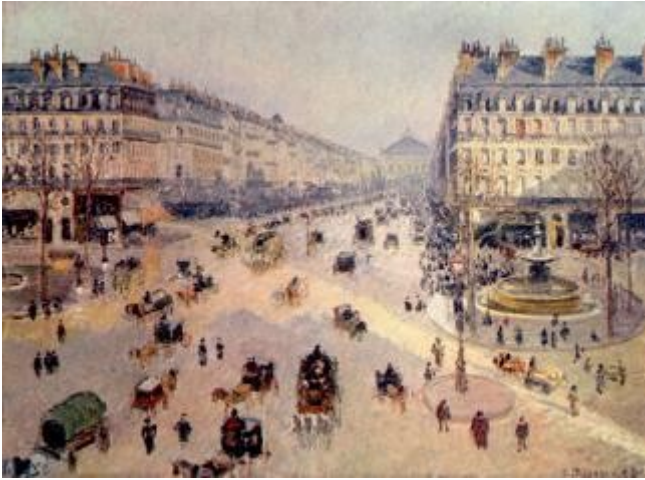
Camille Pissarro, L'Avenue de l'Opéra depuis l'hôtel du Louvre , 1898, Reims, Musée des Beaux-Arts

L'opéra Garnier est situé sur un îlot urbain difficile à mettre en valeur car de forme très irrégulière (proche du losange ou du